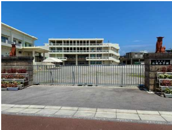
石垣小学校 330m (徒歩 5分)