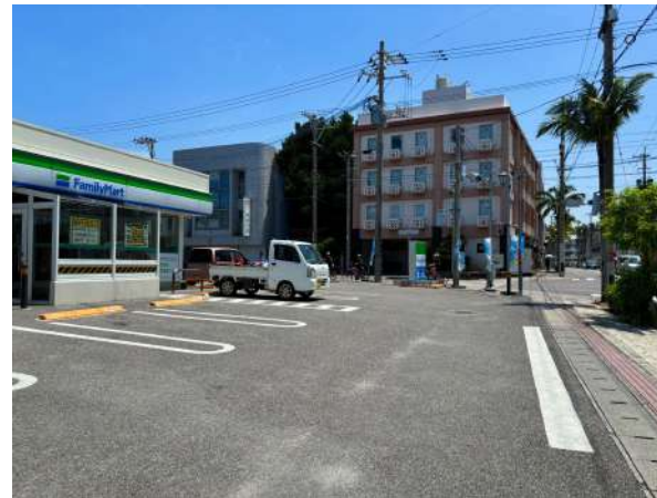
コンビニ 130m (徒歩 2分)