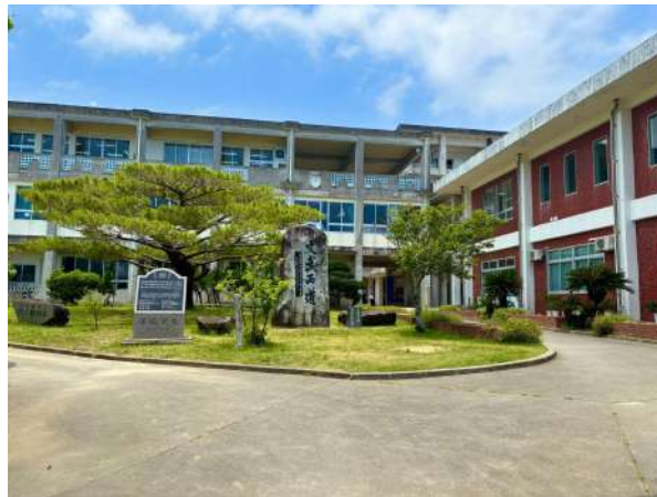
石垣中学校 800m (徒歩 10分)