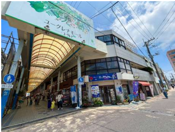
ユーグレナモール 350m (徒歩 5分)