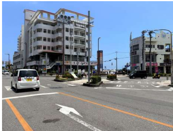
730交差点 550m (徒歩 7分)